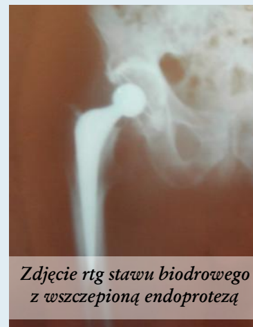
Zdjęcie rtg stawu biodrowego z wszczepioną endoprotezą